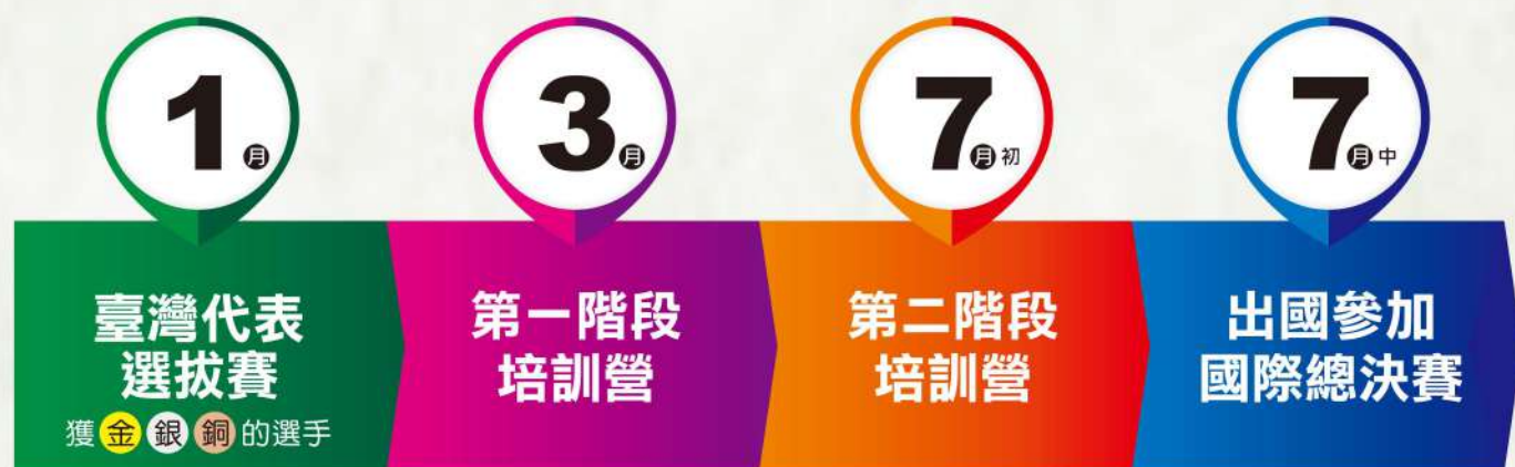
六大數學素養報告書